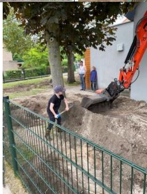
zo vader zo zoon....