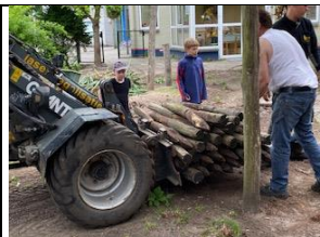
zo vader zo zoon....

Zaterdag hebben de voorbereidende grondwerkzaamheden plaatsgevonden. Mooi om te zien hoeveel werk wordt verzet, waarbij ook enkele kinderen duidelijk laten zien dat zij nu al klaar zijn om het zware werk te gaan doen! De appel valt soms niet ver van de boom.