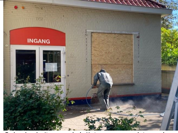
Ook de buitengevel krijgt een complete opknapbeurt waarna de muren geïsoleerd en opnieuw geschilderd kunnen worden.