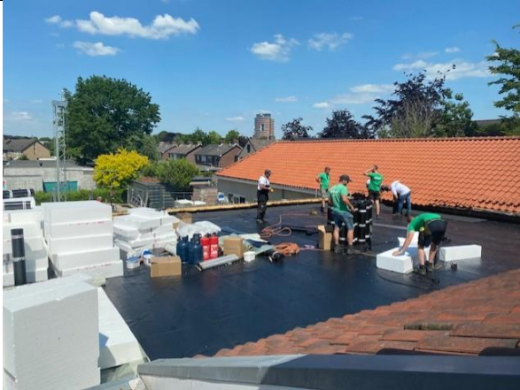
De uitbreiding van de drie lokalen en de tweede speelzaal is inmiddels voorzien van een goed geïsoleerd dak.