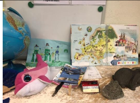
'Waar ben ik' is het thema in groep 4