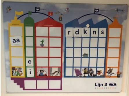
De eerste letters zijn aangeboden in groep 3 Komende week start het thema De Boom