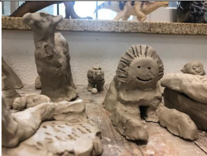
Afrika en Azië: klei in groep 7