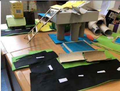
Er wordt flink gebouwd in groep 5