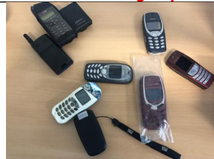
Communicatie in groep 8

De groepen 1-2 zijn bezig met het thema 'mijn lichaam' en vormen.