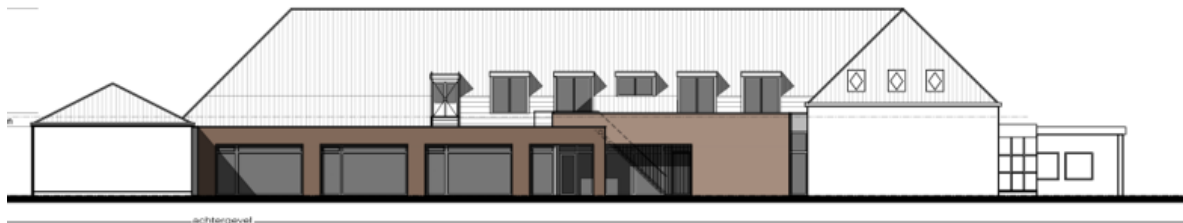
nieuwe achtergevel (uitbreiding 3 lokalen en speelzaal)